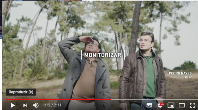
O pinhal e o Nemátodo da Madeira do Pinheiro